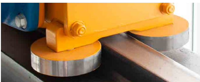
Führungsrollen an der oberen Kranbahn